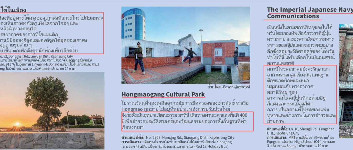
Hongmaogang Cultural Park

การสร้างต้นแบบสืบที่ห้องจินตนาการ ศิลปะการจิวจิวสีสัน ฉากประวัติศาสตร์ที่หลงไปตามกาลเวลา และป่าไม้ที่งดงามที่รอคอยนักท่องเที่ยวและโรมันเด็กจากทั่วโลกกลายเป็นสาขาสวยงามแห่งใหม่และมีความประทับใจที่ใจที่งดงามในใจของคุณ!