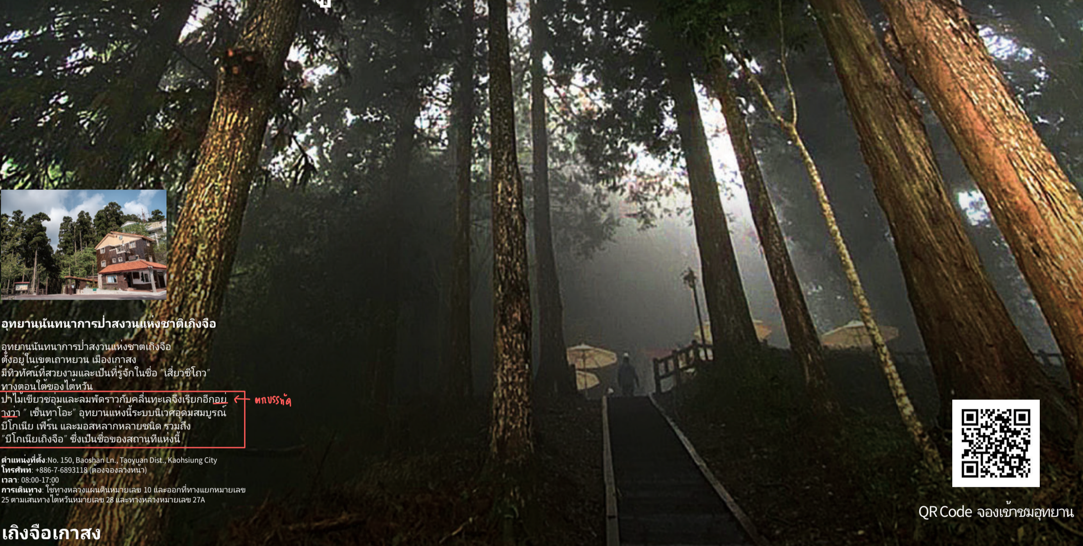
เกิงเจาเกาสง