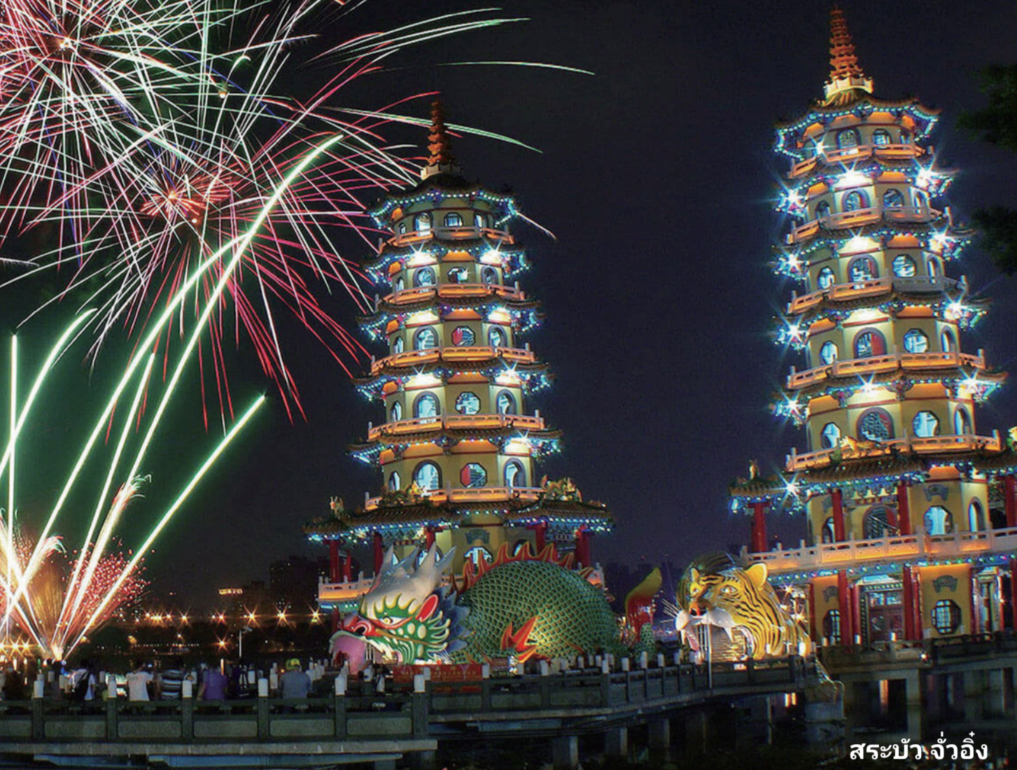
สระบัวจ้งจ้ง

พื้นที่ซึ่งเชื่อกันว่าสร้างและเดินทางสุริยวงชาติ อายามี ใช้ภาพเพื่อไม่สัมผัสระบบนิเวศเป็นเอกลักษณ์ของเกาะ เพื่อเติมเต็มร่างกายและจิตใจ