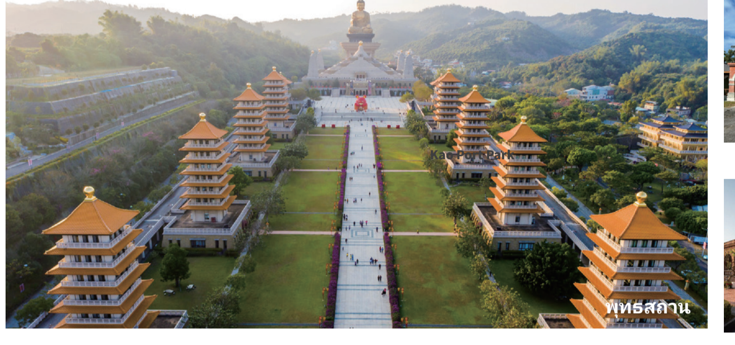
พิพิธสถาน

ท่าเรือเมืองใหญ่ที่เคารพและยอมรับในความหลากหลายของศาสนา หลากหลายความเชื่อสามารถพบเจอได้ที่นี่